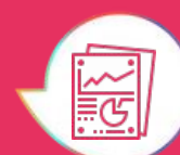
Tab.1 - Distribuzione di casi di notificati per tipologia di infezione e origine del caso (confermati e probabili)